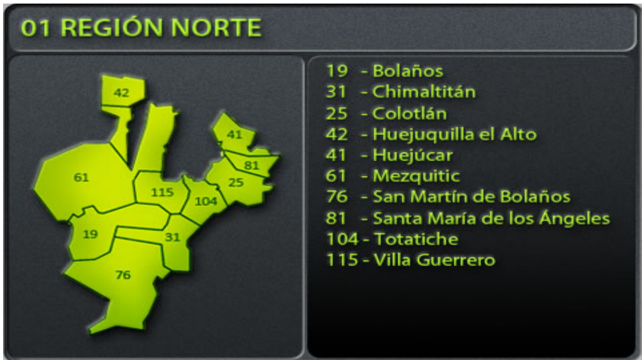
Figura 2. Región Norte de Jalisco: municipios que la conforman